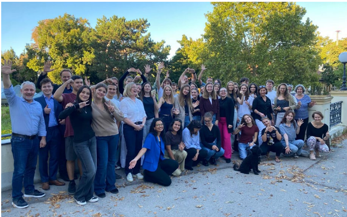
Gelebte Jugendpartizipation – alle Teilnehmenden an der eljub Dialogkonferenz 2025